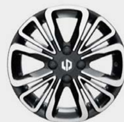
15" hliníkové disky kol