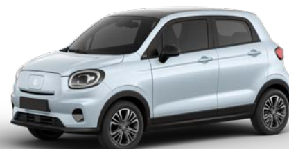
Modrá GLACIER (0XA)* 15 000 Kč * do vyprodání zásob