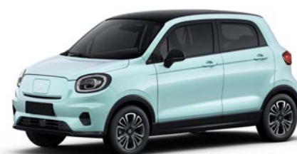
Modrá CARIBBEAN (0XD) 15 000 Kč