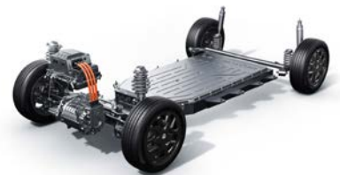
Umístění trakční baterie v podlaze vozu