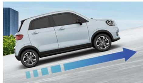
Funkce Autohold (udržení ve svahu)