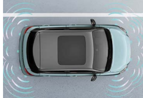
Parkovací senzory & couvací kamera