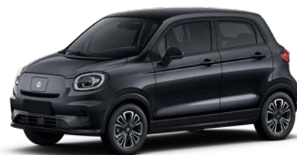
Šedá CANOPY (0GM) 15 000 Kč