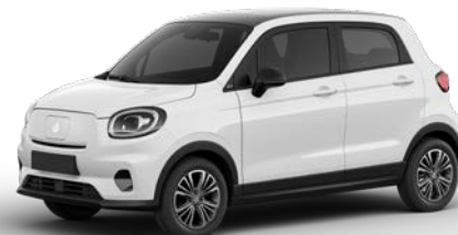
Bílá LIGHT (0AG) 15 000 Kč* * pro modelový rok 24 v ceně vozu