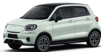
Zelená MINT (0YE)* V CENĚ * výroba končí 31. 3. 2026